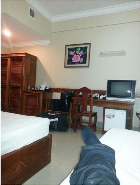
宿泊しているホテルにて

ホテルの部屋です。結構綺麗です。 私達の活動拠点は主にカンボジアのバタンバン州と言う所がメインです。カンボジアでも二番目に人口が多いと言われている地域ですが、首都や観光地のように近代化されて来ている町とは少し違い、タイ国境付近に近く、過去の内戦時カンボジアからタイへ逃げて難民となっていた人々が多く住んでいる所で、カンボジアの国民からは、自分達だけ国を捨てて逃げて行ったとして、差別を受けている地域