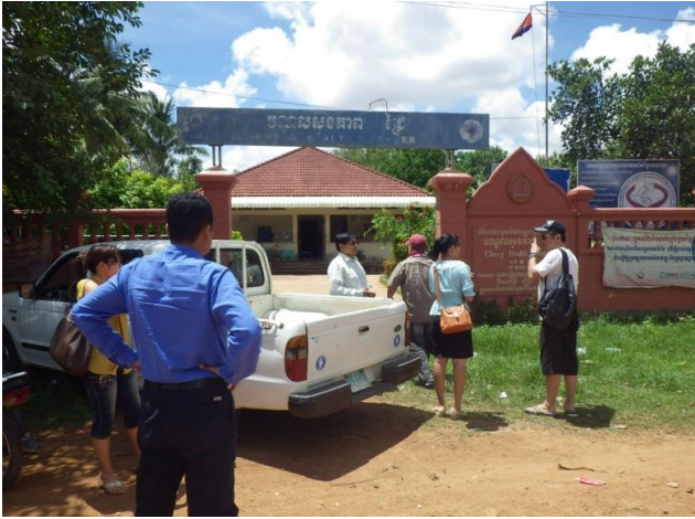
バタンバン州にある診療所にて